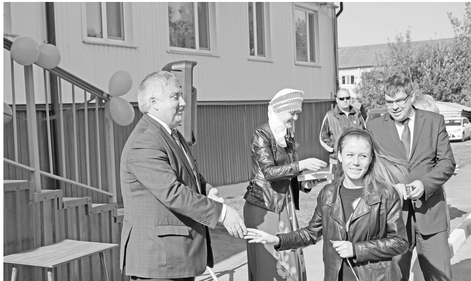
Сентябрь 2017 года. Открытие дома для детей-сирот в п.Думиничи. Новоселам вручили ключи от квартир.

В районе продолжалась газификация, строились жилье, социальные объекты.