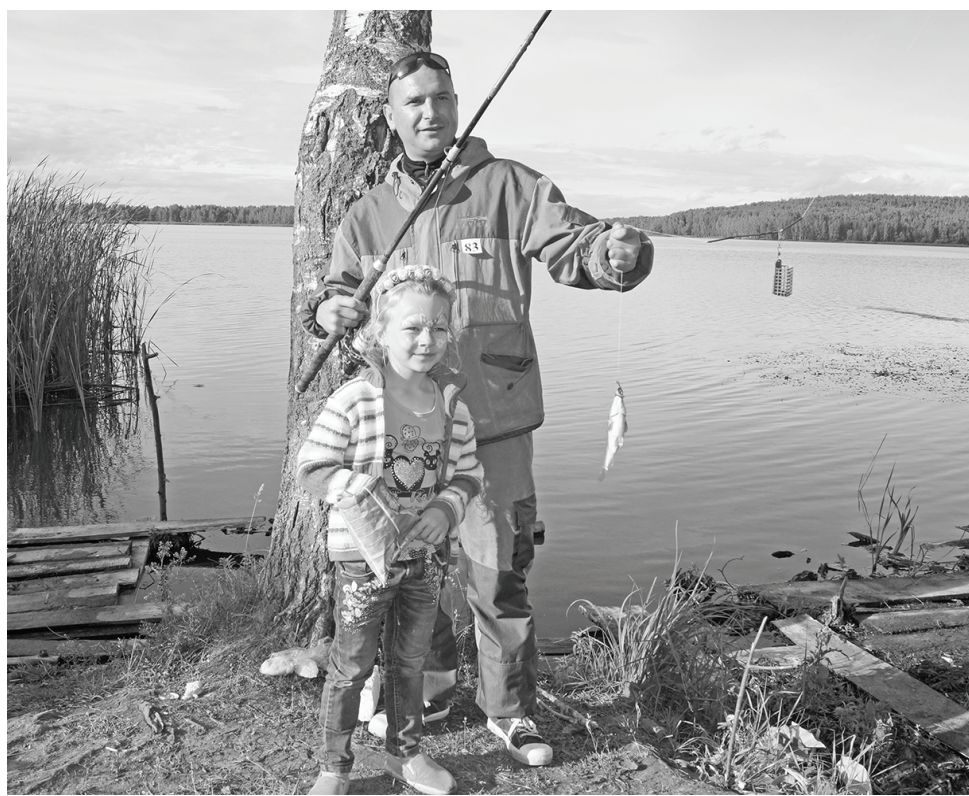
В 2017 году на Брынском пруду впервые прошел Фестиваль рыбалки и семейного отдыха.

Большое внимание уделялось популяризации народных ремесел, Хлудневской игрушки. Интересным, многолюдным был наш знаменитый фестиваль, который второй год подряд проводится на родине гон-