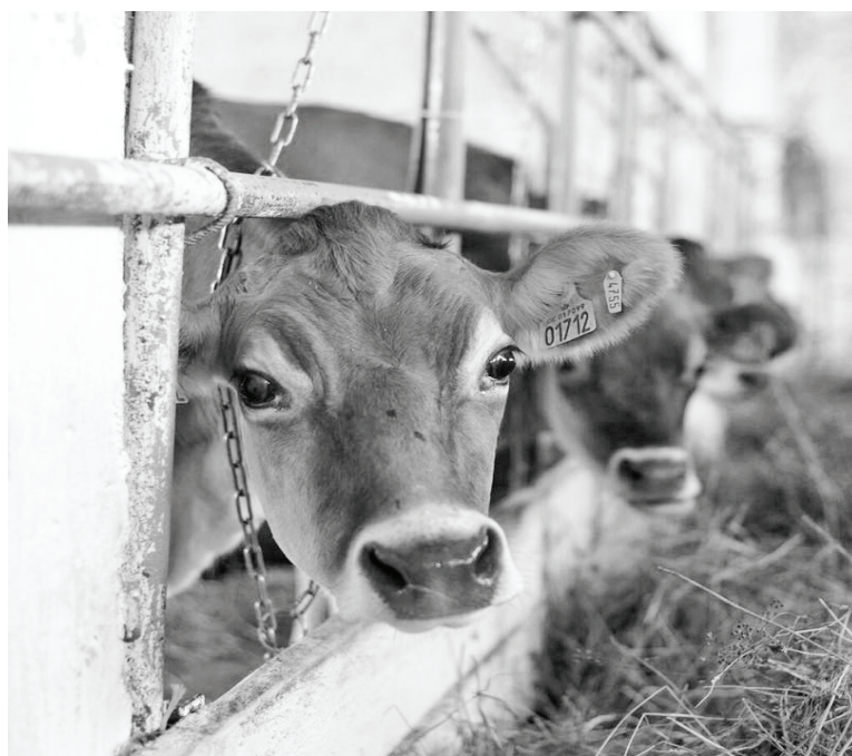
В Котори - не хуже, чем в Дании.