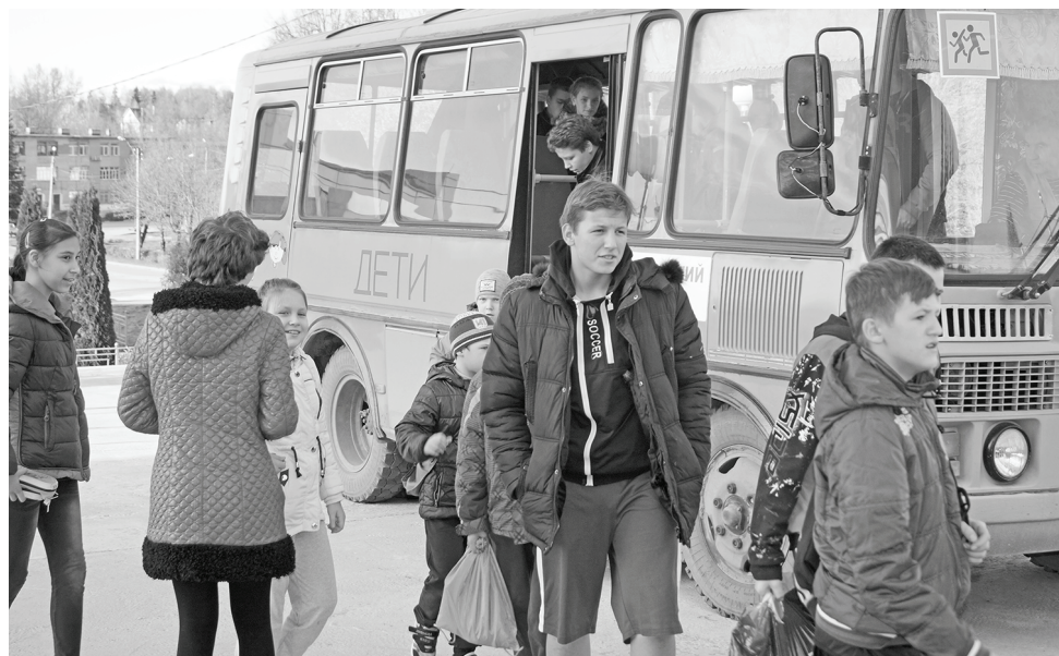
Школьный автобус доставляет ребят из сельских школ на тренировки в ДЮСШ. Занятия проводятся в ФОКе «Заря».

И это должен прочувствовать и осознать каждый из нас. И сделать всё, что от него зависит, для дальнейшего развития родной земли!