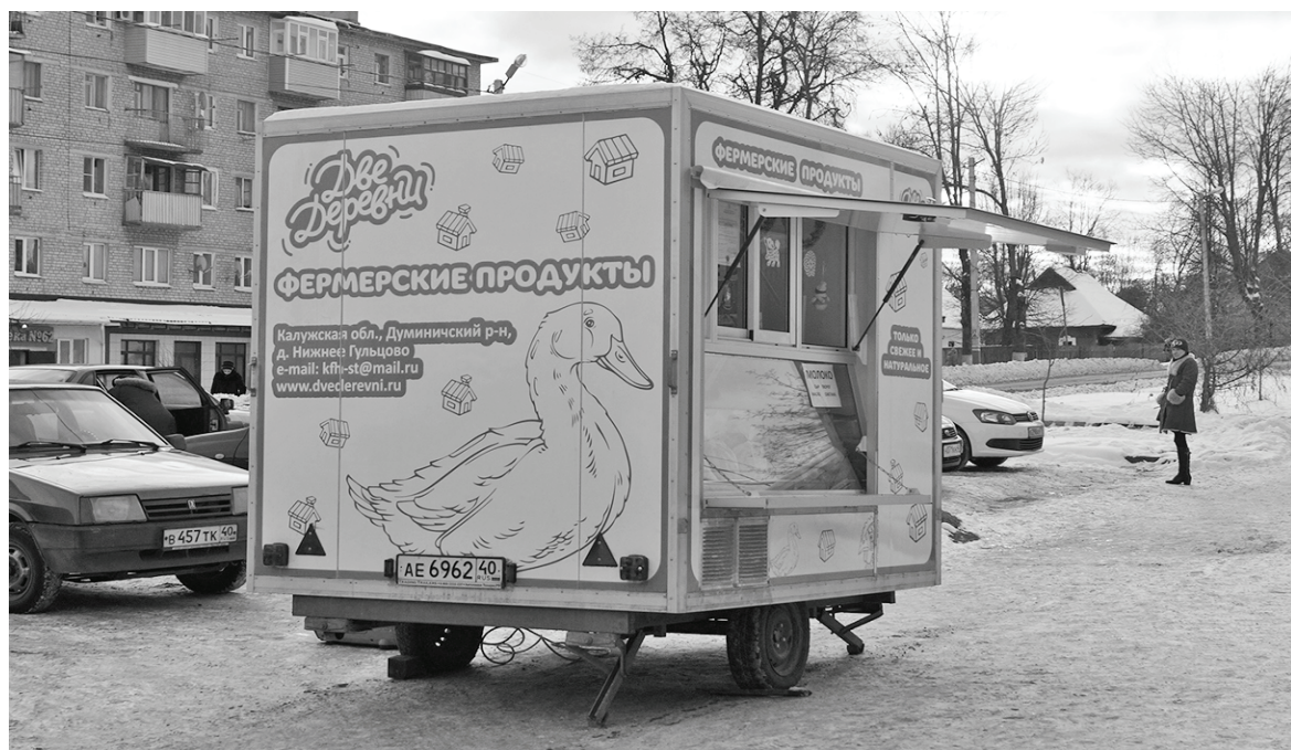
Фирменный вагончик «Две деревни».