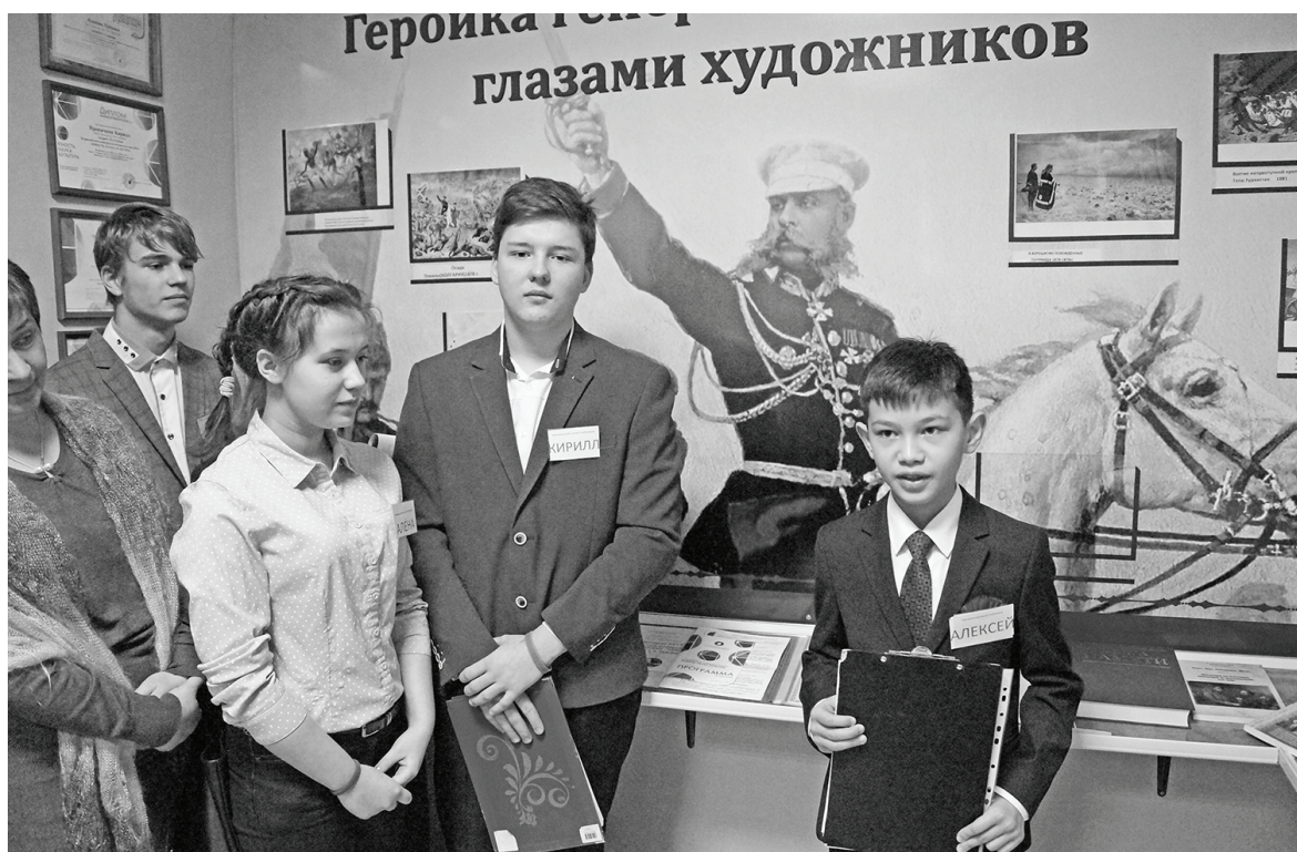
Первая экскурсия в музейной комнате Чернышенской школы.

Приведу краткие выдержки из выступлений: